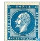
koning Oscar I

Noorwegen had in de 19 e Eeuw al een uitgebreid en goed functionerend net van postroutes. De tarieven waren echter zo hoog dat in 1855 de eerste zegel verscheen met een waarde van 4 skilling met als afbeelding het Noorse wapen en de tekst "firmærke". De kleur was blauw, maar kon variëren van licht tot groenblauwe. Een jaar later (1856) werd koning Oscar I toegevoegd op de zegel met een waarde van 2 skilling die was bedoeld voor de lokale post. Eveneens werd er een zegel uitgegeven van 3 skilling als aanvullingswaarde. In december 1856 werd een zegel (zie afbeelding ) uitgegeven. In 1871 werd de postwet van kracht in Noorwegen en kwam de eerste "posthoornzegel" in omloop. Deze posthoornzegel werd het symbool van de Noorse post. In 1877 kwam in navolging van Zweden en Denemarken ook in Noorwegen het "decimale" stelsel en werd de Skilling vervangen door de Ore.