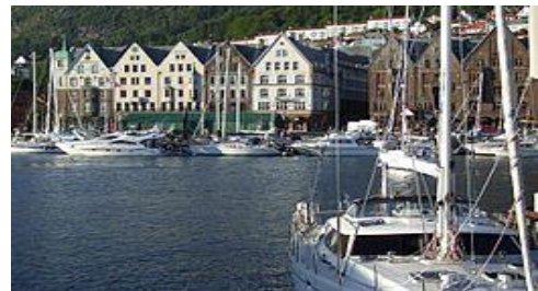
haven van Bergen

De steden op zich zijn al een bezienswaardigheid. Wat te denken van de stad Bergen die zijn naam dankt aan één van de 7 bergen (de Fløyen) waar deze stad tussen ligt. Om van een mooi uitzicht te genieten kun je met kabelbaan naar de top van deze berg. Ook heeft Bergen een oude haven die op de UNESCO-WERELD erfgoed lijst staat. De stad is ook populair bij vakantiegangers die de Noorse fjorden en gletsjers willen zien. Oslo (de hoofdstad) werd in 1624 door een stadsbrand grotendeels verwoest heeft een aantal bezienswaardigheden zoals de 50 musea en de vele galerijen. Ook het fort AKERSHUS wat in 1299 door Haakon V werd gebouwd heeft Oslo jarenlang beschermd tegen indringers. In de 19 e eeuw raakte het fort zijn strategische positie kwijt en werd een bestuurlijk centrum van het Leger. Ook